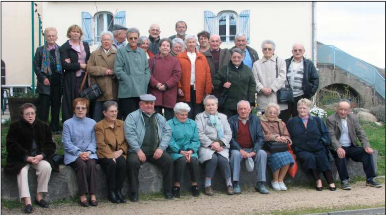
Les membres du club des trois puits le jeudi 13 avril 2006

Le Club des trois Puits reprendra ses activités le jeudi 21 septembre 2006.