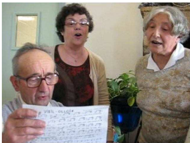
La chorale improvisée